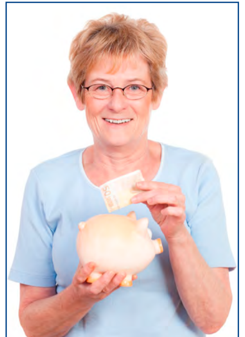
Kirchliche Arbeitgeber bieten diverse Modelle an, Gehalt anzusparen.

Uns liegt viel daran, unsere Mitarbeitenden darin zu unterstützen, den