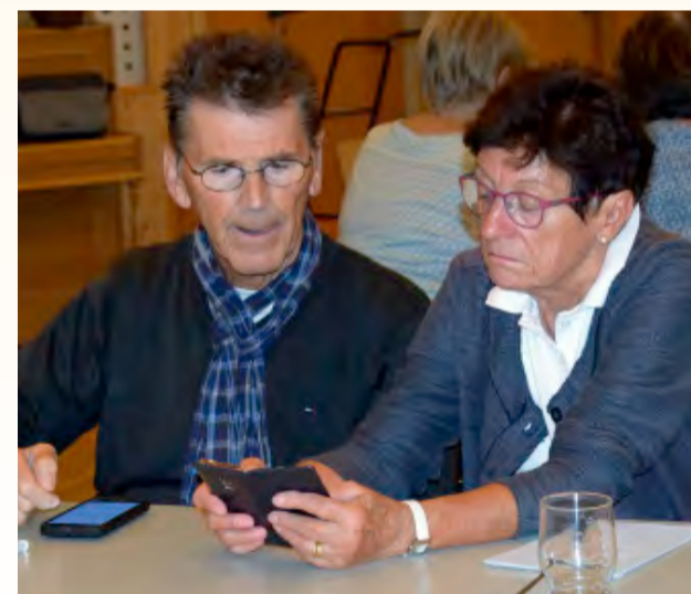
Heiß diskutiert: Welche App ist brauchbar, welche nicht?